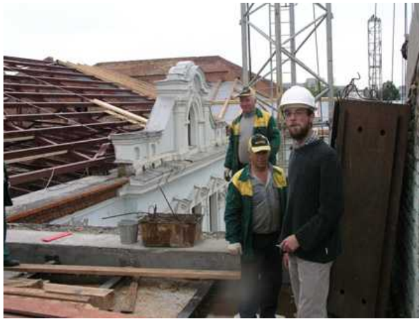
Avec les Obusiens, et la grue qui penche.