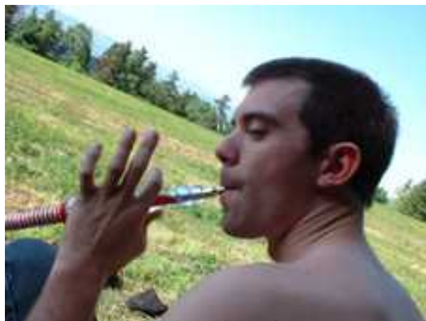
l'inspecteur Kyste mange des legumes et son acolyte aux prises avec le niah-moche

La salade ingurgitée par l'Inspecteur Kyste est signe d'un réel désarroi. D'éminents spécialistes du méchoui, et les irréductibles scientifiques velaves, soupçonnent quelques effets secondaires de l'abus de hamac. Cela dit, le viandox réglera l'affaire.