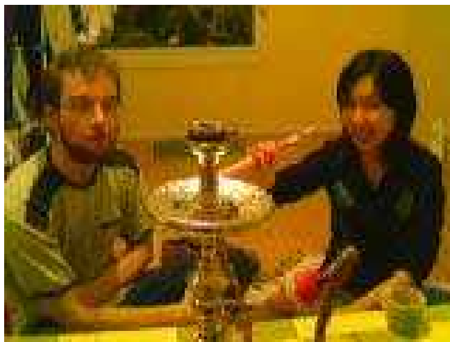
(la photo est floue de à cause que les paparazzis n'ont pas assuré)

A cela, le Couple Tres Magique (puisque le « couple magique » existe déjà a Saint Etienne, depuis Budapest (si si, c'est très clair pour ceux qui ont vécu l'histoire...) sauf que maintenant je crois qu'ils sont au Canada) restera de marbre, et ne mangera pas de sushis, puisqu'ils n'aiment pas ça (les clichés, vous savez depuis longtemps ce qu'on en fait, n'est-ce pas !) [aux chiottes !] NDL T a I G